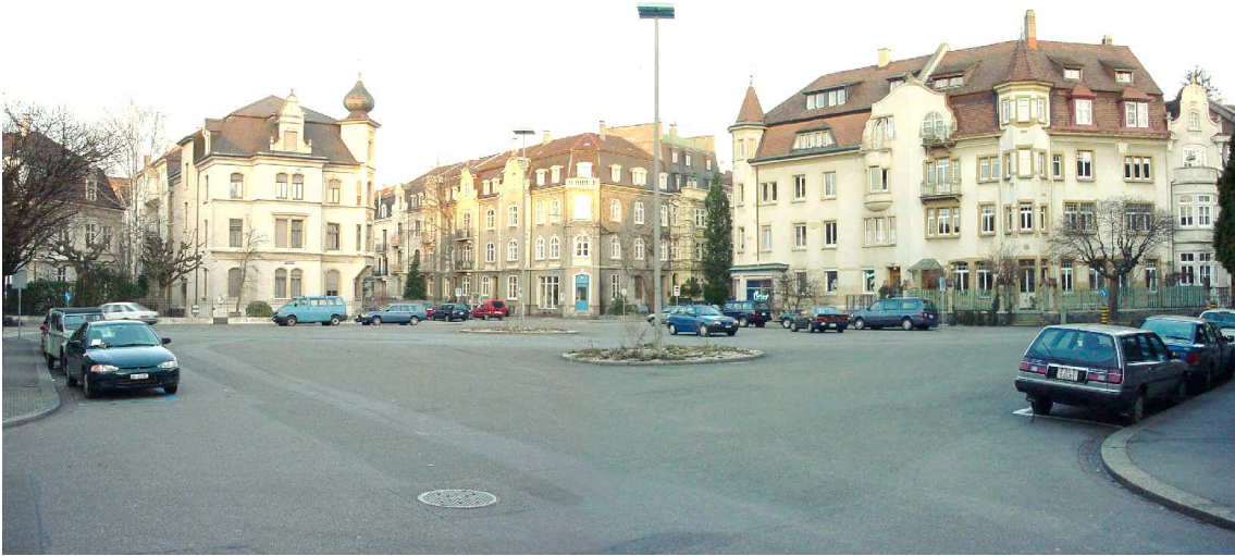
Rütimyerplatz heute (Fotostandort Kreuzung Schaler- und Kluserstrasse – Blick Richtung Platzmitte und Kreuzung Thewiler- und Rothbergerstrasse)