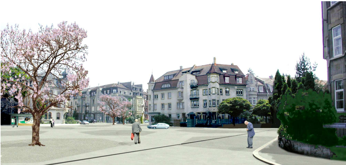
Fotovisualisierung des neu gestalteten Rütimyerplatzes (Fotostandort Kreuzung Schaler- und Kluserstrasse – Blick Richtung Platzmitte und Kreuzung Thewiler- und Rothbergerstrasse)