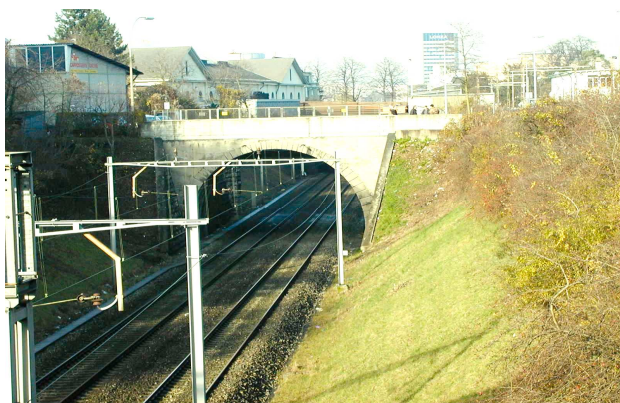
Abb. Nr. 2 Blick auf Bahntrasse, Einschnitt und Walkewegbrücke von Süden her (Brüglingerstrasse)