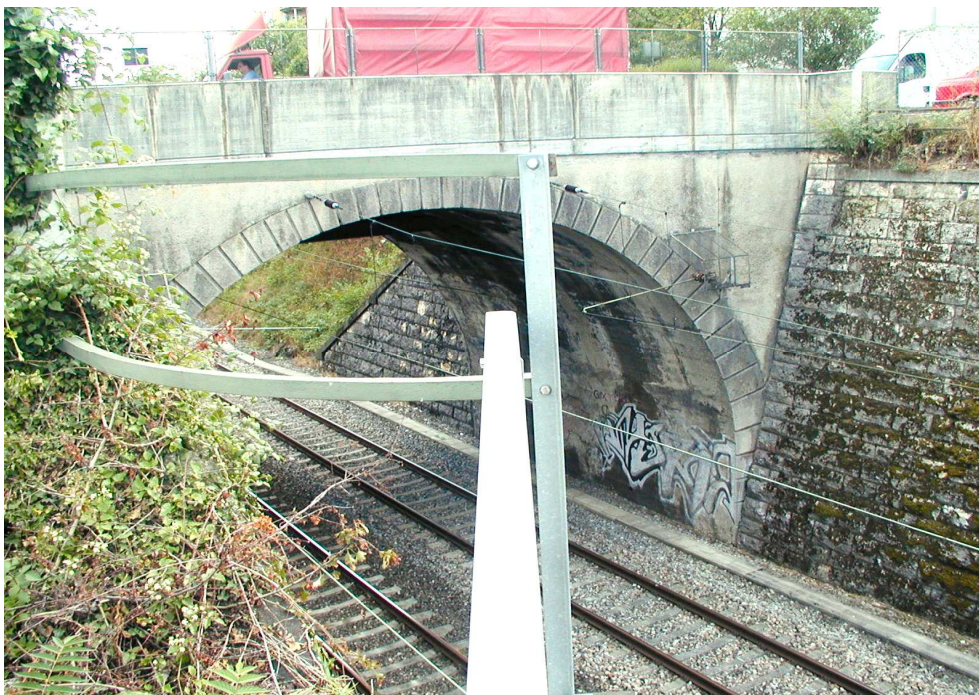
Abb. Nr. 3 Heutige Walkewegbrücke

Während der Bauzeit werden die heutigen Verkehrsbeziehungen durch Provisorien aufrechterhalten.