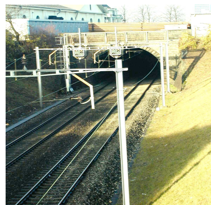
Blick von der Walkewegbrücke in Richtung Südportal Wolftunnel und BVB-Depot

Der Zugang zu den Perrons erfolgt beidseitig ab der Walkewegbrücke über je zwei Treppen von 2,0 m Breite. Ausserdem erleichtert auf jeder Seite ein Lift den Perronzugang, wovon zum einen Behinderte und zum anderen Fahrgäste mit Gepäck, Velos oder Kinderwagen profitieren. Eine stufenlose Rampe, wie sie im Vorprojekt als Alternative zum Lift untersucht worden war, wurde verworfen, weil sie mit einer Neigung von 10 - 12% eindeutig zu steil wäre (i.d.R. sind 6% akzeptabel). Ein weiterer Treppenabgang von der Brüglingerstrasse aus ist hingegen nicht vorgesehen (geringer Publikumsverkehr, zusätzliche Kosten).