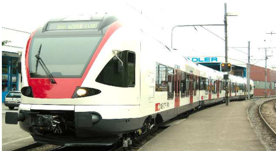
FLIRT (Quelle: Schweizer Eisenbahn-Revue; aufgenommen am Roll-Out vom 4.6.2004)