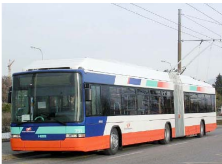
Modernster Swiss Trolley 3 der Genfer-Verkehrsbetriebe TPG, 2005.

Aber auch im Ausland hat der Trolleybus Zukunft. Weltweit fahren zur Zeit in 370 Städten in 47 Ländern rund 40'000 Trolleybusse. Zahlreiche Städte erneuern den Fahrzeugpark, und es entstehen auch neue Linien und ganze Netze.