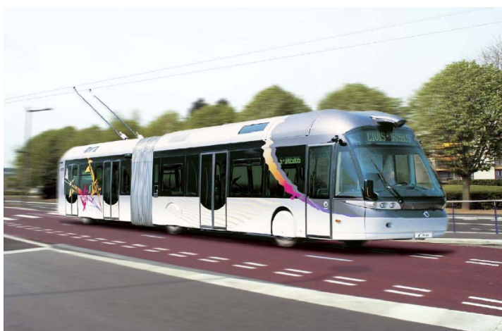
Modernster Cristalys-Trolleybus in Frankreich im Einsatz.

Neue Trolleybussysteme wurden in den Jahren 2005/2006 u.a. in folgenden Städten eingerichtet: Lecce (Italien) drei Linien mit 20 Kilometern Länge, Rom eine Linie mit 30 Trolleybussen, Landskrona (Schweden) eine Linie. In zahlreichen Städten wurden und werden bestehende Netze erweitert, zum Beispiel in Bratislava um zwei Linien.