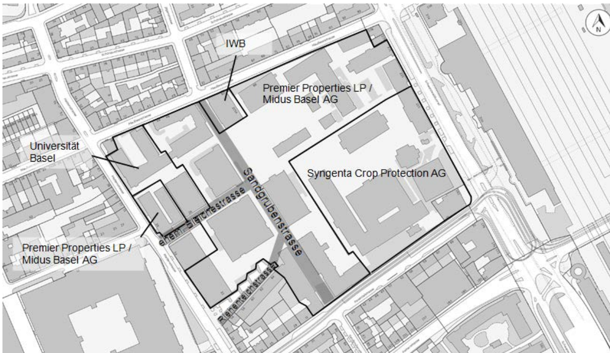
Abbildung 1: Eigentumsverhältnisse Rosental-Areal (Quelle: Geodaten Kanton Basel-Stadt, 2014)

„Im Jahr 2007 hat die Syngenta Crop Protection AG entschieden, sich am Standort Basel künftig auf Headquarterfunktionen zu konzentrieren. Deshalb hat sie grosse Teile ihrer Liegenschaft im Rosental an Premier Properties LP/Midus Basel AG veräussert und sich auf eine Parzelle von rund einem Drittel der ursprünglichen Fläche beschränkt. Die ehemalige Energieversorgungsanlage der Syngenta ist seit 2008 im Eigentum der IWB. Einige Parzellen wurden 2011 durch die Universität erworben und abparzelliert, mit dem Ziel, den Universitätsstandort Rosental auszubauen. Der nachfolgende Plan stellt die Eigentumsverhältnisse dar. Ebenfalls sind darin die durch die Petenten zum Kauf oder zur Enteignung vorgeschlagenen Strassen eingezeichnet.“