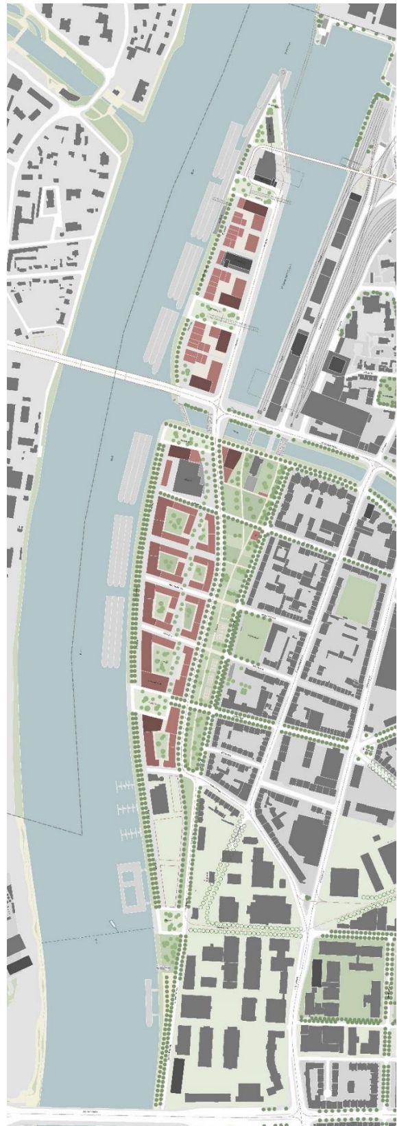
Abbildung 1: Städtebauliches Konzept «eine Stadterweiterung am Rhein» (2019)

An städtebaulich wichtigen Punkten öffnen sich Plätze zum Wasser und bilden einprägsame, besondere Orte der Urbanität am Rhein.