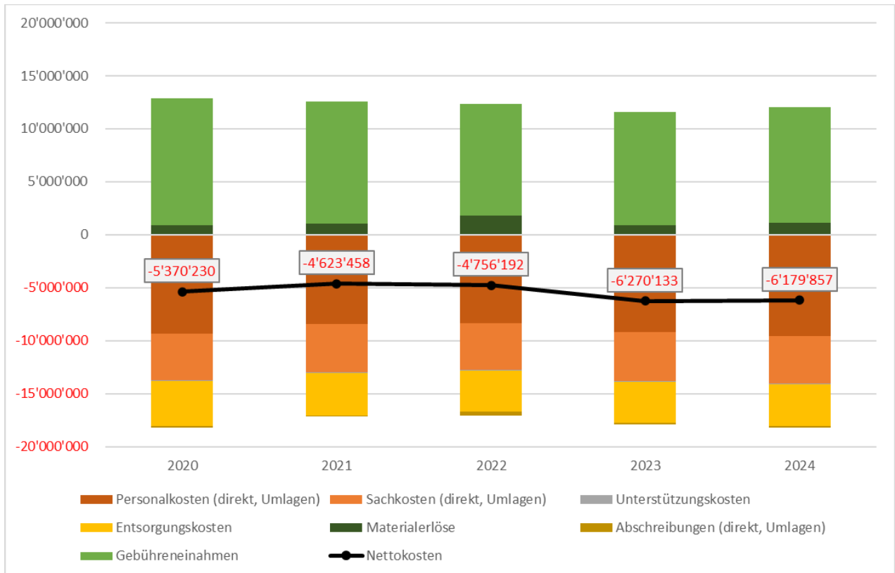
Abbildung 1: Aufwände und Erträge, ohne Kosten aus Abfällen aus Littering oder öffentlichen Abfalleimern, gemäss Kostenrechnung der Jahre 2020 bis 2024. Die resultierenden Nettokosten (Aufwand minus Ertrag) als schwarze Linie, ohne Berücksichtigung der Reserveauflösung 2024