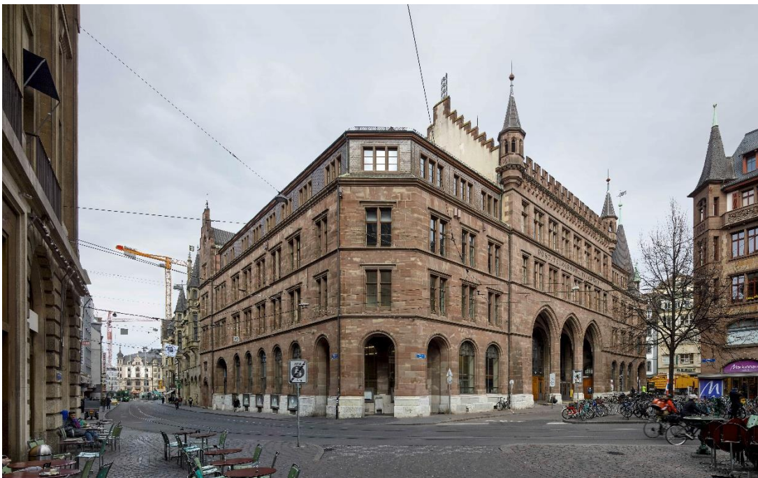
Aussenansicht der der alten Hauptpost von der Gerbergasse aus